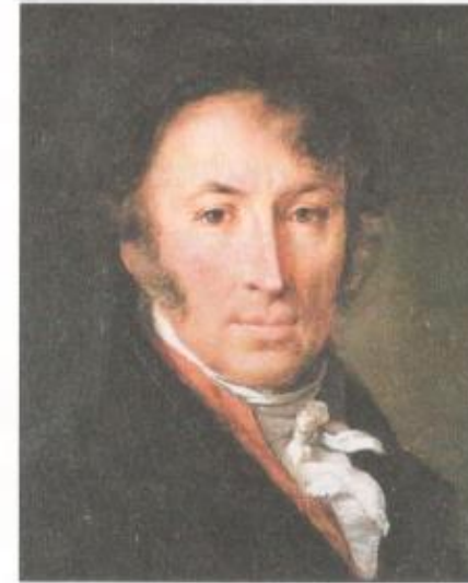
Н. М. Карамзин

► В Петровскую эпоху в связи с активной внешне-политической деятельностью Петра I в русский язык вошли многочисленные заимствования из немецкого, английского, голландского языков, связанные с военным и морским делом, механикой и техникой, государственным управлением. Это, например, слова армия, батальон, пушка, пистолет; флот, шлюпка, катер, матрос, юнга; фабрика, цех, инструмент, механик; губерния, паспорт, канцелярия, документ и др. Во время правления Екатерины II в русский язык также вошли слова из многих западноевропейских языков, но наиболее частотными были