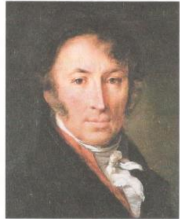
Н. М. Карамзин

► В Петровскую эпоху в связи с активной внешнеполитической деятельностью Петра I в русский язык вошли многочисленные заимствования из немецкого, английского, голландского языков, связанные с военным и морским делом, механикой и техникой, государственным управлением. Это, например, слова армия, батальон, пушка, пистолет; флот, шлюпка, катер, матрос, юнга; фабрика, цех, инструмент, механик; губерния, паспорт, канцелярия, документ и др. Во время правления Екатерины II в русский язык также вошли слова из многих западноевропейских языков, но наиболее частотными были