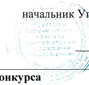
График проведения городского этапа конкурса «Учитель года города Казани-2024»